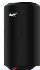
Ref. 01025 Acabado: Negro Finitura: Nero Potencia: 1.200 W Potenza: 1.200 W