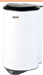
Ref. 01021 Acabado: Blanco Finitura: Bianco Potencia: 1.200 W Potenza: 1.200 W