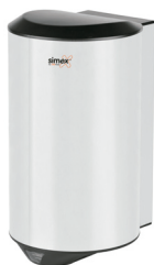
Ref. 01024 Acabado: Brillante Finitura: Brillante Potencia: 1.200 W Potenza: 1.200 W