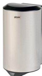
Ref. 01023 Acabado: Satinado Finitura: Satinato Potencia: 1.200 W Potenza: 1.200 W