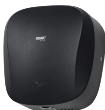
Ref. 01084 Finish: Matt black Finition: Noir mat Power: 1.400 W Puissance: 1.400 W