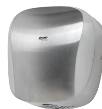
Ref. 01086 Finish: Satin Finition: Satiné Power: 1.400 W Puissance: 1.400 W