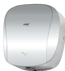
Ref. 01085 Finish: Polished Finition: Brillant Power: 1.400 W Puissance: 1.400 W