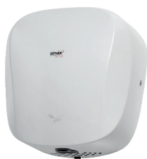
Ref. 01083 Finish: White Finition: Blanc Power: 1.400 W Puissance: 1.400 W