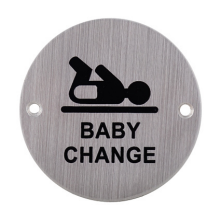
Ref. 05115 Cambia pañales Fasciatoio