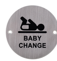
Ref. 05115 Baby changing station Table à langer