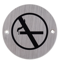
Ref. 05117 No smoking Défense de fumer