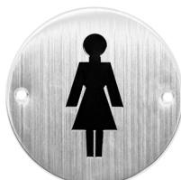
Ref. 05112 Toilet woman Toilettes pour femmes