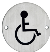
Ref. 05113 Adapted toilet Toilettes pour handicapés