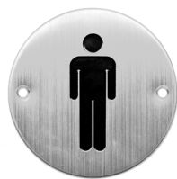
Ref. 05111 Toilet man Toilettes pour hommes