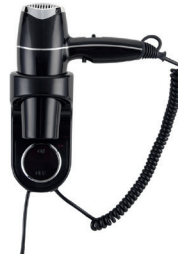
Ref. 01033 Finish: Black Finition: Noir Power: 2.000 W Puissance: 2.000 W