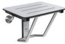
Ref. 02038 Finish: Satin Finition: Satiné