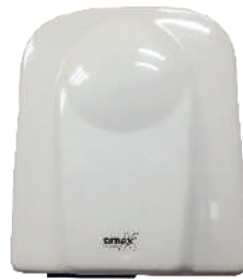
Ref. 01055 Finish: White Finition: Blanc Power: 1.650 W Puissance: 1.650 W