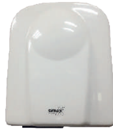
Ref. 01055 Finish: White Finition: Blanc Power: 1.650 W Puissance: 1.650 W