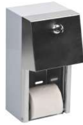
Ref. 06030 Finish: Satin Finition: Satiné Material: SUS 304 S. Steel Matériel: Acciaio inox. AISI 304