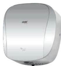
Ref. 01085 Finish: Polished Finition: Brillant Power: 1.400 W Puissance: 1.400 W