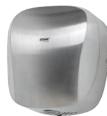
Ref. 01086 Finish: Satin Finition: Satiné Power: 1.400 W Puissance: 1.400 W