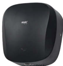
Ref. 01084 Finish: Matt black Finition: Noir mat Power: 1.400 W Puissance: 1.400 W