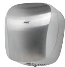
Ref. 01086 Finish: Satin Finition: Satiné Power: 1.400 W Puissance: 1.400 W