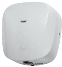
Ref. 01083 Finish: White Finition: Blanc Power: 1.400 W Puissance: 1.400 W