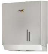
Ref. 06013 Finish: Satin Finition: Satiné Material: Stainless steel Matériel: Acier inox.