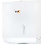
Ref. 06014 Finish: White Finition: Blanc Material: Steel Matériel: Acier