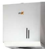
Ref. 06001 Acabado: Brillante Finitura: Brillante Material: Acero inox. Materiale: Acciaio inox.