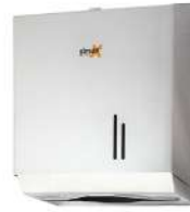
Ref. 06001 Finish: Polished Finition: Brillant Material: Stainless steel Matériel: Acier inox.