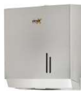
Ref. 06013 Acabado: Satinado Finitura: Satinato Material: Acero inox. Materiale: Acciaio inox.