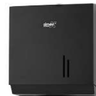
Ref. 06057 Acabado: Negro Finitura: Nero Material: Acero Materiale: Acciaio