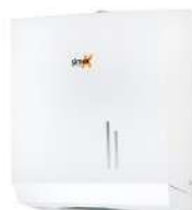
Ref. 06014 Acabado: Blanco Finitura: Bianco Material: Acero Materiale: Acciaio