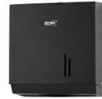
Ref. 06057 Finish: Black Finition: Noir Material: Steel Matériel: Acier