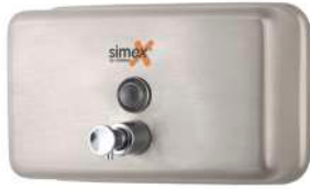
Ref. 04005 Finish: Satin Finition: Satiné