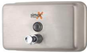
Ref. 04005 Acabado: Satinado Finitura: Satinato