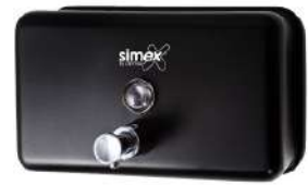
Ref. 04054 Acabado: Negro Finitura: Nero