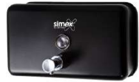
Ref. 04054 Finish: Black Finition: Noir