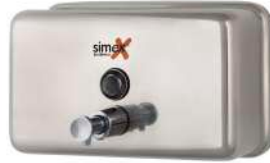
Ref. 04019 Finish: Polished Finition: Brillant