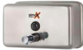
Ref. 04019 Acabado: Brillante Finitura: Brillante