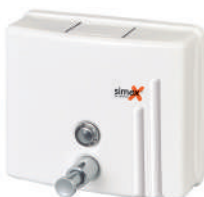
Ref. 04024 Acabado: Blanco Finitura: Bianco