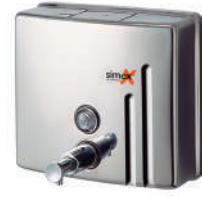
Ref. 04025 Finish: Polished Finition: Brillant