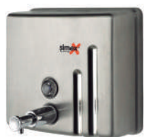
Ref. 04023 Acabado: Satinado Finitura: Satinato