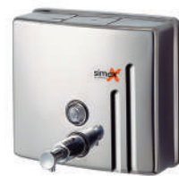
Ref. 04025 Acabado: Brillante Finitura: Brillante