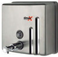
Ref. 04023 Finish: Satin Finition: Satiné