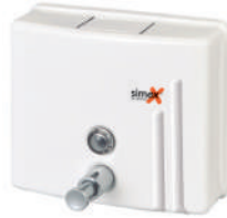
Ref. 04024 Finish: White Finition: Blanc