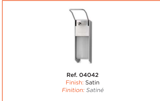
Ref. 04042 Finish: Satin Finition: Satiné