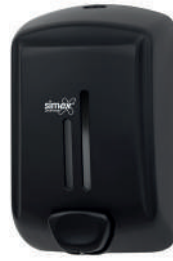
Ref. 04077 Acabado: Negro Finitura: Nero