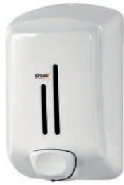
Ref. 04076 Finish: White. Finition: Blanc.