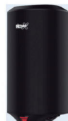
Ref. 01025 Acabado: Negro Finitura: Nero Potencia: 1.200 W Potenza: 1.200 W