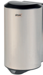
Ref. 01023 Finish: Satin Finition: Satiné Power: 1.200 W Puissance: 1.200 W