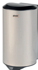
Ref. 01023 Acabado: Satinado Finitura: Satinato Potencia: 1.200 W Potenza: 1.200 W