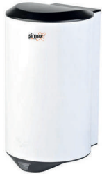
Ref. 01021 Finish: White Finition: Blanc Power: 1.200 W Puissance: 1.200 W