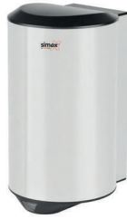
Ref. 01024 Finish: Polished Finition: Brillant Power: 1.200 W Puissance: 1.200 W