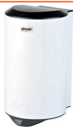
Ref. 01021 Acabado: Blanco Finitura: Bianco Potencia: 1.200 W Potenza: 1.200 W