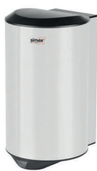
Ref. 01024 Acabado: Brillante Finitura: Brillante Potencia: 1.200 W Potenza: 1.200 W