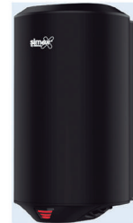
Ref. 01025 Finish: Black Finition: Noir Power: 1.200 W Puissance: 1.200 W