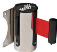
Ref. 08010 Color cinta: Rojo Colore nastro: Rosso