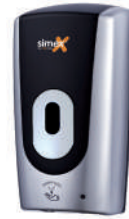
Ref. 04041 Finish: Black Finition: Noir