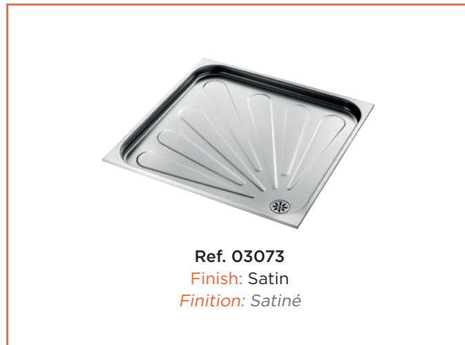
Ref. 03073 Finish: Satin Finition: Satiné