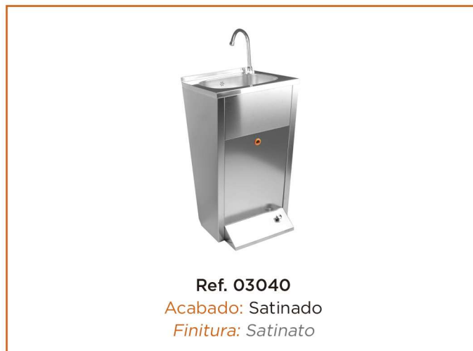
Ref. 03040 Acabado: Satinado Finitura: Satinato