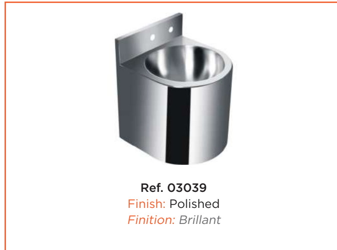
Ref. 03039 Finish: Polished Finition: Brillant