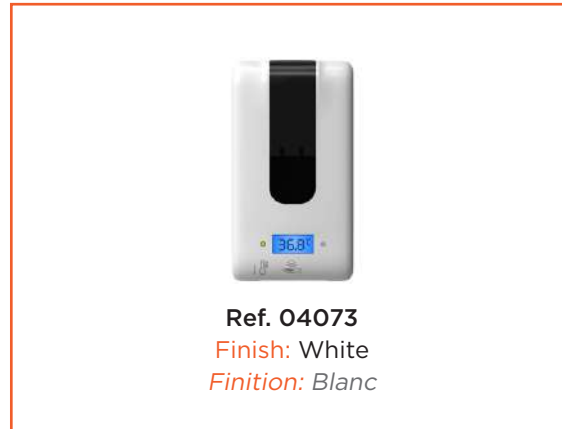
Ref. 04073 Finish: White Finition: Blanc