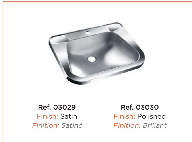
Ref. 03029 Finish: Satin Finition: Satiné