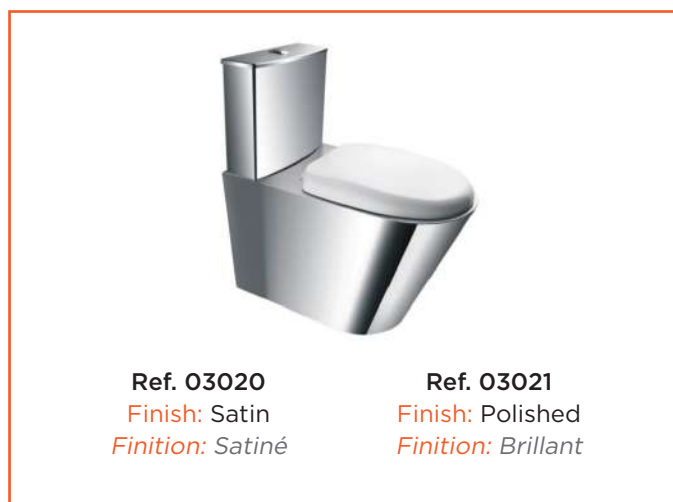
Ref. 03020 Finish: Satin Finition: Satiné