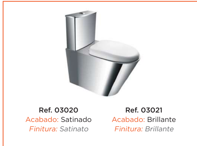
Ref. 03020 Acabado: Satinado Finitura: Satinato