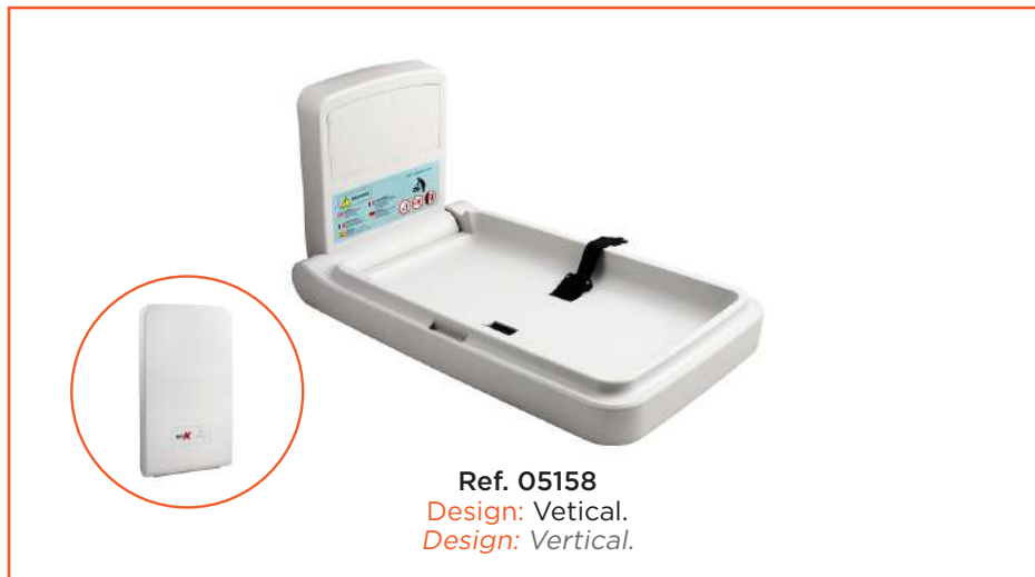
Ref. 05158 Design: Vetical. Design: Vetical.