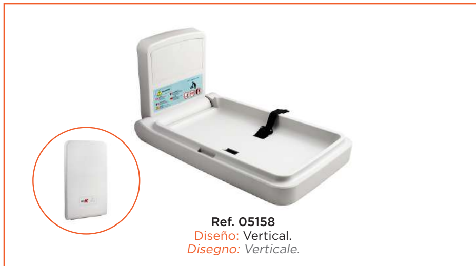
Ref. 05158 Diseño: Vertical. Disegno: Verticale.