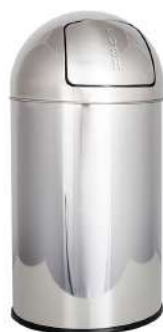
Ref. 07003 Acabado: Brillante Finitura: Brillante