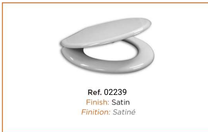
Ref. 02239 Finish: Satin Finition: Satiné