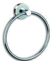
Ref. 05020 Acabado: Brillante Finitura: Brillante