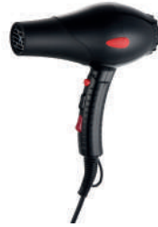
Ref. 01032 Finish: Black Finition: Noir Power: 2.100 W Puissance: 2.100 W