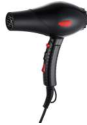
Ref. 01032 Finish: Black Finition: Noir Power: 2.100 W Puissance: 2.100 W