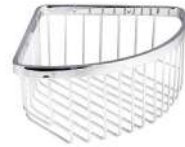
Ref. 05096 Finish: Polished Finition: Brillant