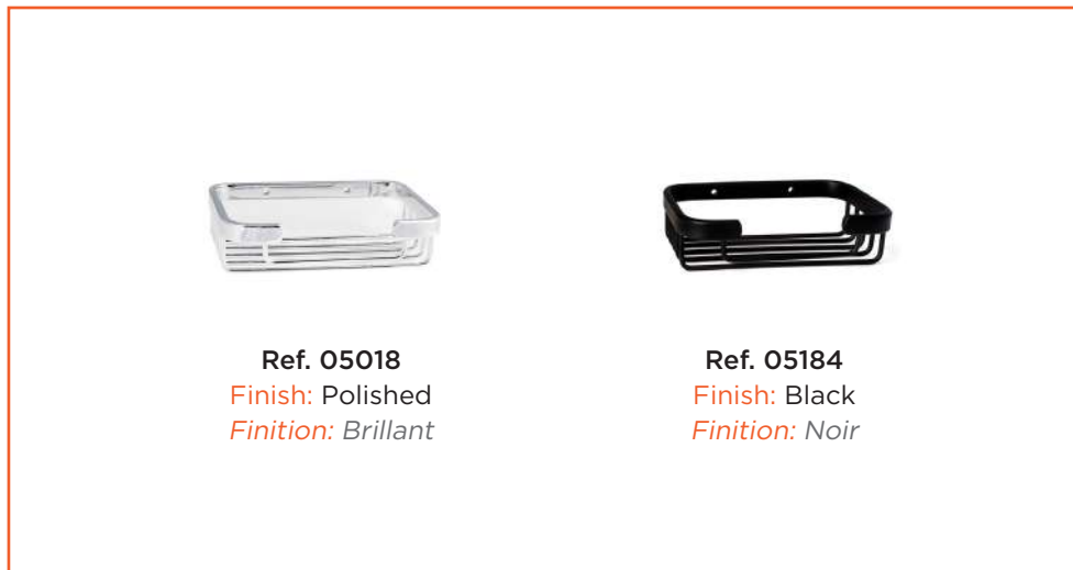
Ref. 05018 Finish: Polished Finition: Brillant