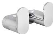
Ref. 05170 Acabado: Brillante Finitura: Brillante