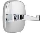
Ref. 05008 Finish: Polished Finition: Brillant