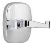
Ref. 05008 Acabado: Brillante Finitura: Brillante