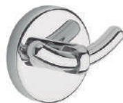
Ref. 05101 Acabado: Brillante Finitura: Brillante