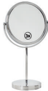
Ref. 05197 Finish: Polished Finition: Brillant