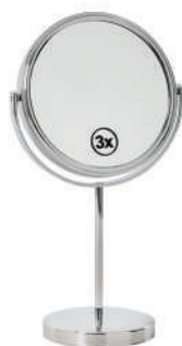
Ref. 05197 Acabado: Brillante. Finitura: Brillante.