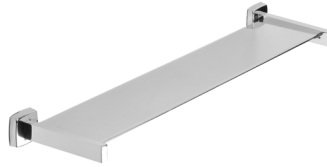
Ref. 05137 Finish: Polished Finition: Brillant