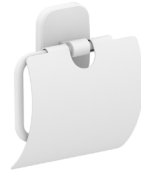
Ref. 05190 Finish: Matt white Finition: Blanc mat