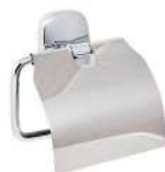
Ref. 05010 Acabado: Brillante Finitura: Brillante