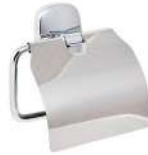
Ref. 05010 Finish: Polished Finition: Brillant