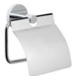
Ref. 05019 Acabado: Brillante Finitura: Brillante