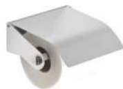
Ref. 05085 Acabado: Brillante Finitura: Brillante