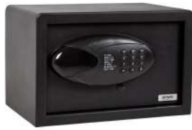
Ref. 08093 Acabado: Negro Finitura: Nero