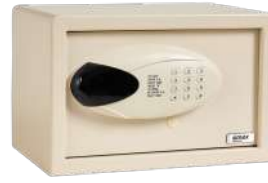
Ref. 08094 Finish: Ivory Finition: Ivoire