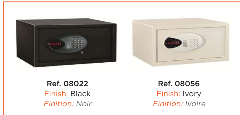
Ref. 08022 Finish: Black Finition: Noir