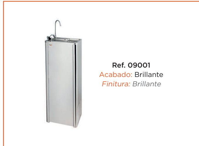
Ref. 09001 Acabado: Brillante Finitura: Brillante