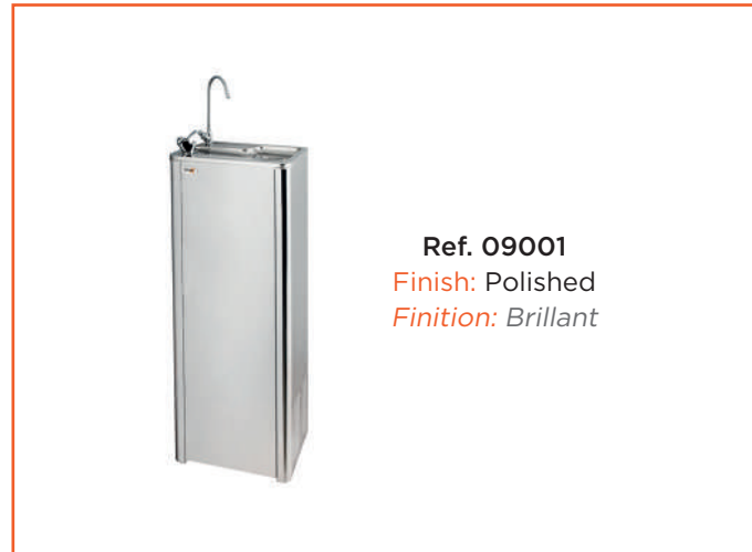
Ref. 09001 Finish: Polished Finition: Brillant